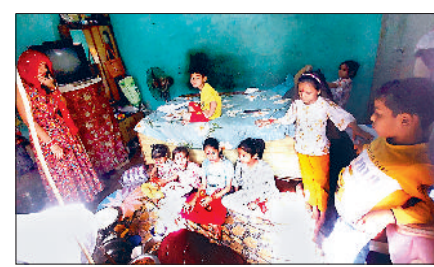
झज्जर। कन्याओं का पूजन करते हुए श्रद्धालु।

झज्जर। अष्टमी के दिन शहर में समाज का एक अलग ही रूप देखने को मिला। गलियों, मोहल्लों में करीब दस बजे तक लोग नंगे पैर अपने परिवार सहित इधर-उधर घूमते हुए दिखाई दिए। जिस घर में कन्याओं का पूजन किया जा रहा था, उसके बाहर अन्य परिवारों के तीन-चार सदस्य कन्याओं को अपने घर लेने जाने का इंतजार कर रहे थे। स्थिति यह रही कि कन्याओं को भोजन कराने के लिए श्रद्धालुओं को लंबा इंतजार करना पड़ा। अष्टमी के दिन श्रद्धालुओं ने नवरात्र के व्रत को कन्याओं के पूजन के साथ खोला और प्रसाद ग्रहण किया। श्रद्धालुओं ने कन्याओं का विधि विधान से पूजन किया और भोजन करवाते हुए उपहार भी भेंट किए।