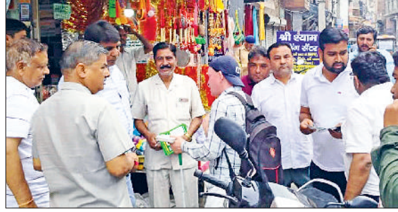
बहादुरगढ़। बाजार में दुकानदारों से अपील करते इनलो कार्यकर्ता।