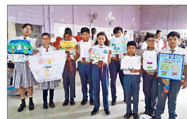
झज्जर। मतदान विषय पर आधारित रंगोली व स्लोगन दिखते हुए विद्यार्थी।