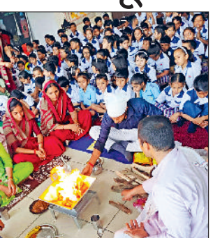
हवन में आहुति डालते शिक्षक व विद्यार्थी।

बहादुरगढ़। इलाके में दुर्गा अष्टमी का पर्व श्रद्धा और उत्साह के साथ मनाया गया। घर-घर कन्याओं का पूजन हुआ। लोगों ने देवी मां की अराधना की और कन्याओं को भोजन कराया। कन्याओं को प्रसन्न करने के लिए श्रद्धालुओं ने उनको सुंदर उपहार भी भेंट किए। वहीं दूसरी तरफ मंदिरों में भी खूब रौनक रही। मंदिरों में धार्मिक कार्यक्रम हुए। सुबह और शाम के वक्त भक्तों की भीड़ उमड़ी रही। कीर्तन-भजन के जरिये मां की महिमा का गुणगान किया गया। वहीं, कुछ स्कूलों में भी कार्यक्रम हुए। ग्लोबल हाइट्स स्कूल में हवन किया गया। यज्ञ में आहुति डालकर शिक्षकों और विद्यार्थियों ने सुख-शांति की कामना की। विद्या की देवी को भी नमन किया गया। अंत में प्रसाद वितरित किया गया।