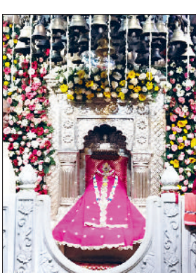
बेरी। मां भीमेश्वरी देवी की प्रतिमा, माता के दर्शनों के लिए उमड़ी श्रद्धालुओं की भीड़।

श्रद्धालुओं का सैलाब उमड़ने का जो सिलसिला सोमवार सांय शुरू हुआ वह मंगलवार अष्टमी के दिन दोपहर तक जारी रहा। मां के दर्शनार्थ आने वाले श्रद्धालुओं ने बिना किसी परेशानी को महसूस किए मां के दर्शनों के लिए घंटों इंतजार करते हुए माता के दर्शन किए और अपने परिवार की सुख स्मृति की कामना की। अष्टमी पर बाहर के मंदिर में जब मां की प्रतिमा लाई गई तो पूरा मंदिर परिसर मां के जयकारों से गुंज उठा। मां के अंदर के मंदिर से बाहर के मंदिर में प्रतिमा लाने की जिम्मेदारी कड़ी सुरक्षा के साथ निभाई गई। पूरे रास्ते में मां के जयकार गुंजते रहे। इसके बाद मां के दर्शनार्थ हजारों की संख्या में श्रद्धालु निरंतर जयघोष के साथ मंदिर तक बढ़ते रहे। मां भीमेश्वरी के