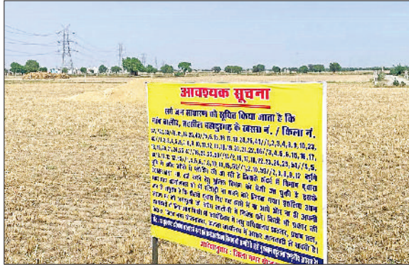
बहादुरगढ़। जमीन पर लगाया गया नोटिस बोर्ड।