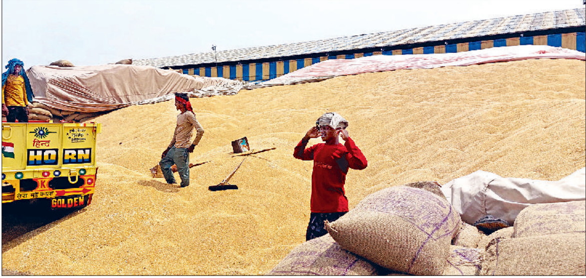
झज्जर। अनाज मंडी परिसर में लगी गेहूं की ढेरियां।

गेहूं व सरसों फसल की बिन्नी के दौरान अनाज मंडियों में किसानों को किसी तरह की परेशानी ना हो, इसके लिए प्रशासनिक स्तर पर किए गए पुख्ता इंतजामों के दावे फेल होते दिखाई दे रहे हैं। किसानों को जहां गेट पास कटवाने के लिए घंटों लाइन में खड़े होकर इंतजार करना पड़ रहा है, वहीं उठान कार्य धीमी गति से होने के कारण भी आड़ती परेशान है। स्थिति यह है कि मंडी परिसर में दिनभर जाम की स्थिति बनी रहती है और आड़ती जैसीबी के माध्यम से गेहूं की ढेरियों को ऊंचा उठाने का प्रयास करते हुए दिखाई दे रहे