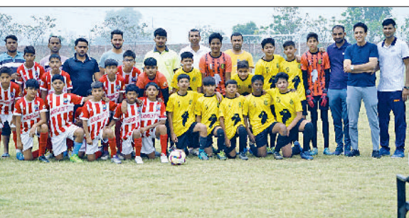
बहादुरगढ़। मैच के दौरान दोनों टीमों के खिलाड़ी कोच के साथ।