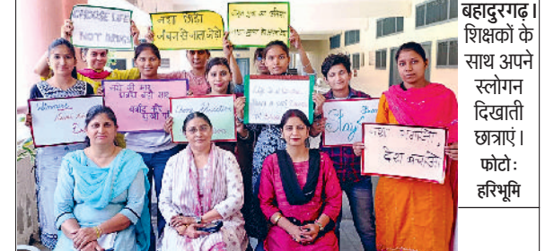
बहादुरगढ़। शिक्षकों के साथ अपने स्लोगन दिखाती छात्राएं।

सुधारने के लिए किए गए कार्यों का ब्योरा दिया। साथ ही उपस्थित सभी उद्योगपतियों की समस्याओं को विस्तारपूर्वक सुनकर उनको जल्द से जल्द ठीक करने का आश्वासन दिया। साथ ही उन्होंने कई समस्याओं का समाधान तुरंत किया। एएसई ने कहा कि बिजली निगम अपनी ओर से पूरा प्रयास कर रहा है कि जिले के उद्योगों को आगामी गर्मियों में बिजली की कमी और पावर कट का कम से कम सामना करना पड़े। साथ ही उद्योगों के लिए संदेश दिया कि बिजली से संबंधित कोई भी समस्या है तो एक बार बिजली कार्यालय में स्थित सेवा केंद्र दर्ज जरूर कराएं।